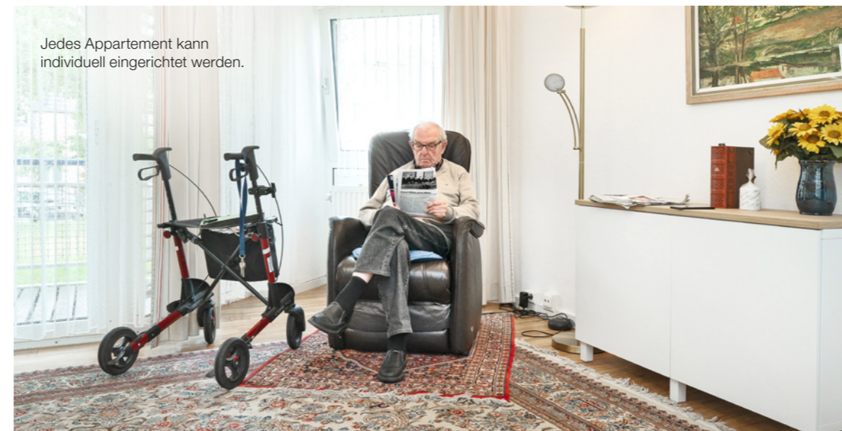
Jedes Appartement kann individuell eingerichtet werden.

Unmittelbar an den parkähnlichen Anlagen des ehemaligen Landesgartenschau Geländes der Stadt Grevenbroich gelegen ist die Fußgängerzone nur einen kurzen Fußweg entfernt. Hier befinden sich sämtliche Geschäfte des täglichen Bedarfs, vielfältige Dienstleister sowie ansprechende Gastronomie und Cafés. Eine gute Anbindung an den ÖPNV sowie ein ausreichendes Parkangebot ermöglichen Ausflüge und entspannte Besuche für Angehörige.